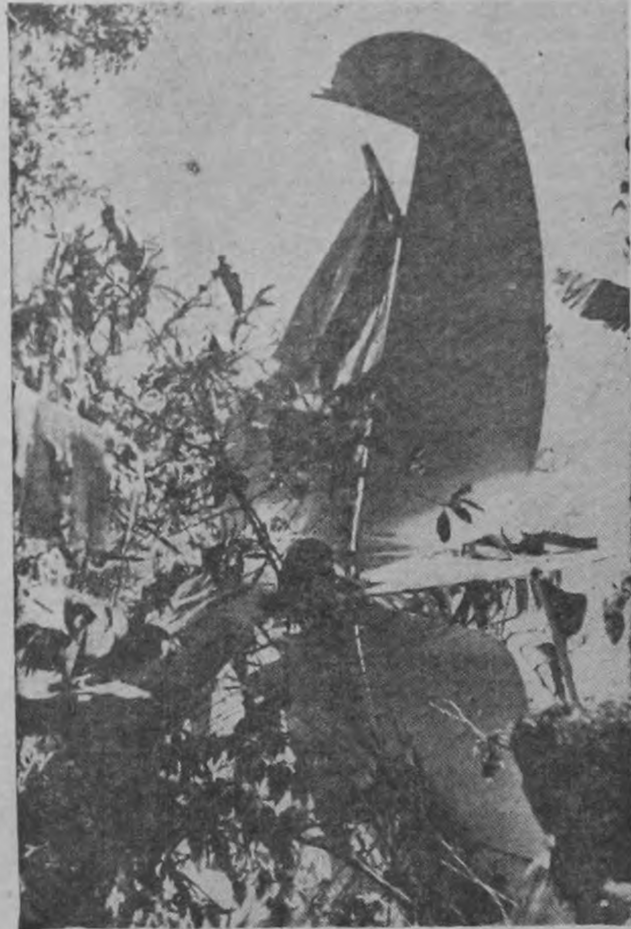
ESTO ERA LA ESTRUCTURA DE COLA de un avión Piper absolutamente nuevo. Esta es la parte trasera del aparato, la que generalmente sufre con menor intensidad el choque. Los timones de profundidad y el de dirección quedaron completamente retorcidos y convertidos en una cosa que no se parece a un aeroplano.

Servicio Informativo de la International News Service. Representante en E. U.: Melchor Guzmán Inc. Representante en Inglaterra: Atlantic Pacific Representations. Gerencia de Anuncios y Económicos: 294 - Apartado 2130. Suscripción en el país: $ 5.00 mensuales. Teléfonos: Suscripciones y Agencias: 1011. - Dirección y Gerencia: 1014. La colaboración será solicitada, no se devuelven originales de artículos.