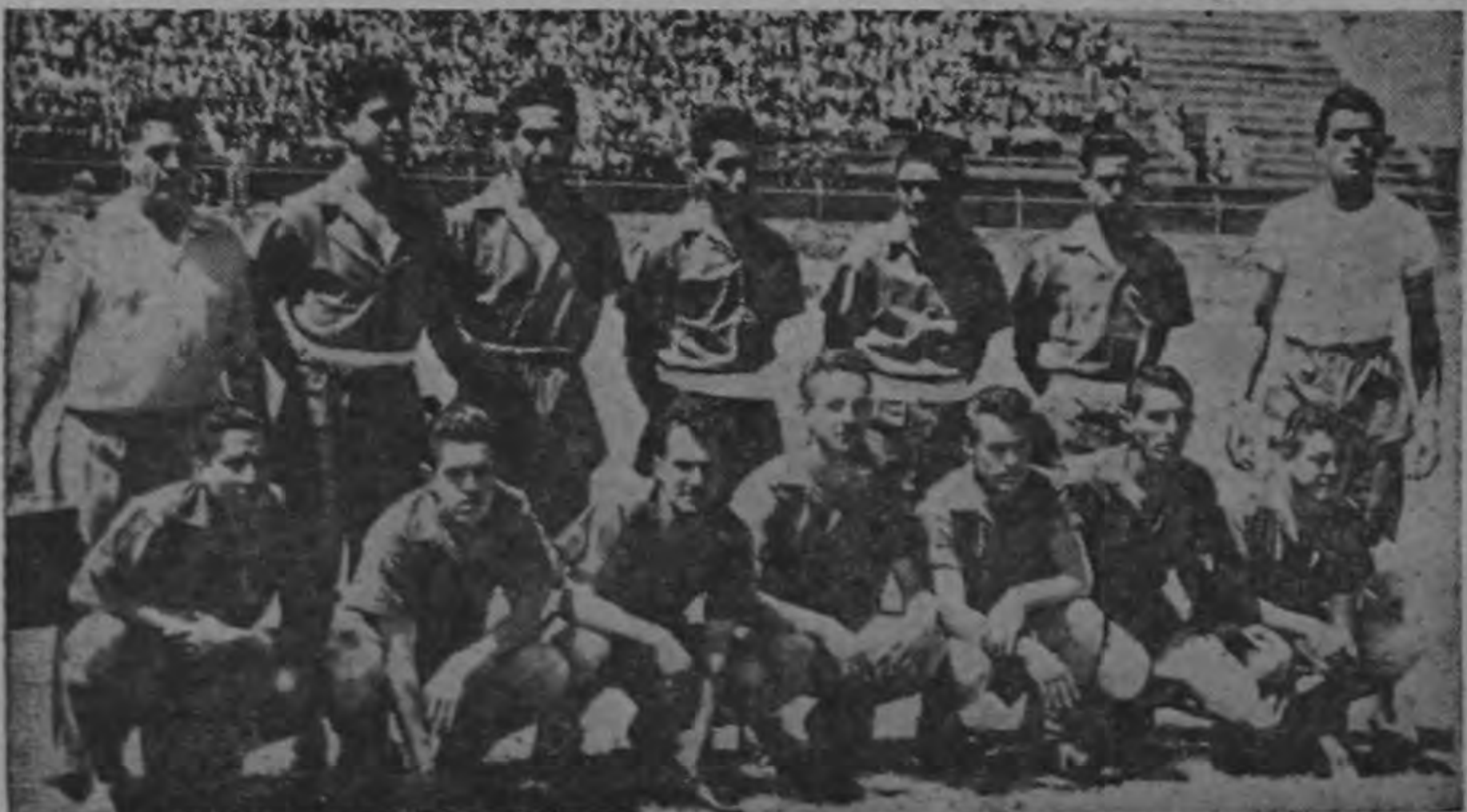
Orión dispuesto a presentarle fiero batalla a los monarcas del fútbol