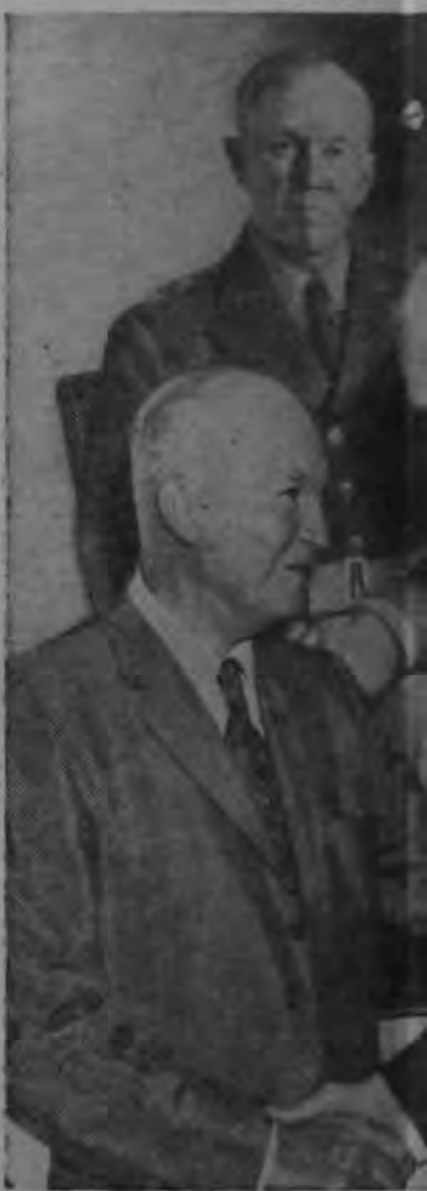
El Presidente Eisenhower felicitado por el ejército George C. Marshall, al décimo aniversario del inicio del tratado de Marshall cuando era jefe de estado y secretario de estado y defensa naval y un reloj, regalos de los embajadores.