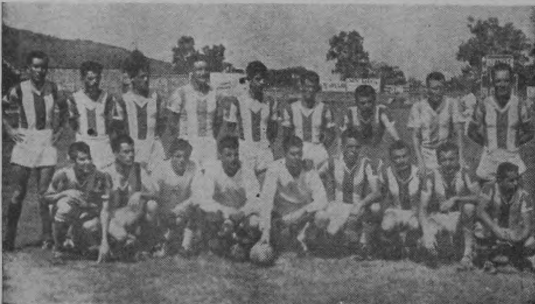
Los brumosos tienen confianza en vencer a los libertos en su propio reducto