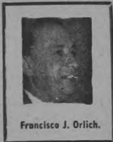
Francisco J. Orlich.

PRIMERA PUBLICACION: 1o. DE MARZO DE 1957 SEGUNDA PUBLICACION: HOY