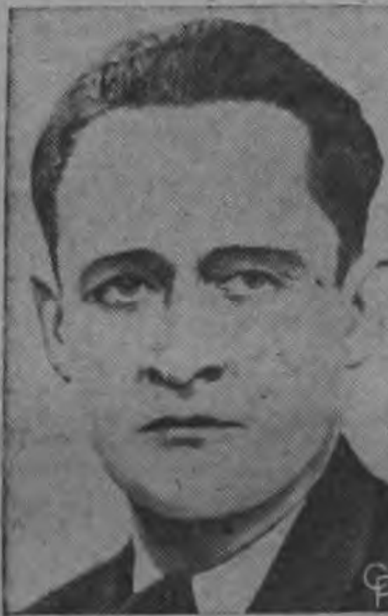
Maurice Bourges Maunoury será Premier.

Integraron la Asamblea, que funcionó en uno de los locales del Servicio Civil, 26 representantes que trajeron el criterio de todas las dependencias y el voto favorable de las provincias para realizar el paro en protesta por el largo papeleo en la tramitación de la Ley de Salarios — (TEXTO EN PAGINA 7) —