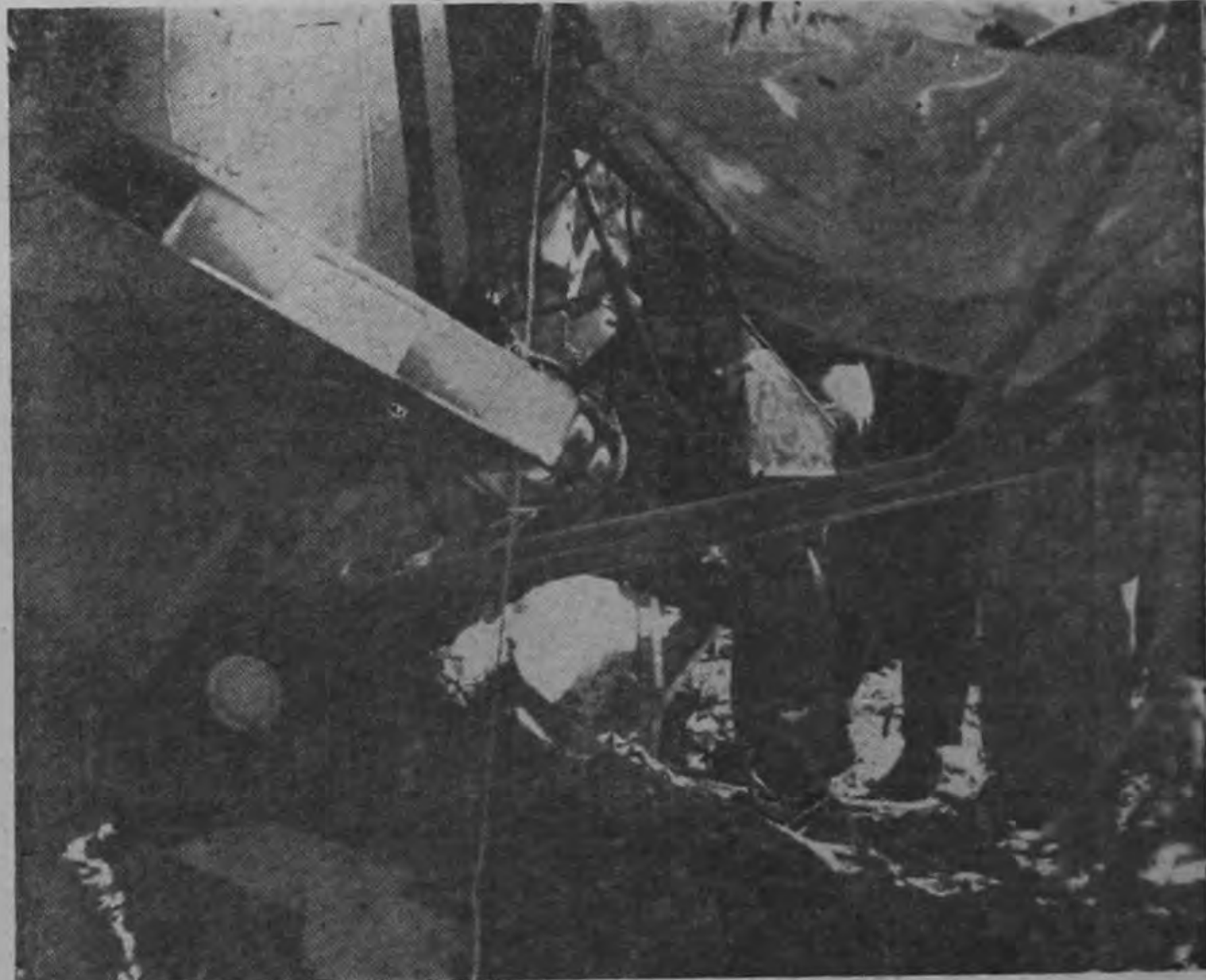
UN "STALL" A CUARENTA PIES DEL SUELO.—He aquí otra vista de los pedazos que quedaron de la Piper biplaza Tipo PA-18, que despegó a las nueve y veinte de la mañana de ayer, desplomándose a los dos minutos de vuelo. Los expertos de la Dirección de Aeronáutica Civil llegaron inmediatamente al sitio del desastre e inspeccionaron los restos para confeccionar el informe rutinario. (Foto SOLANO).