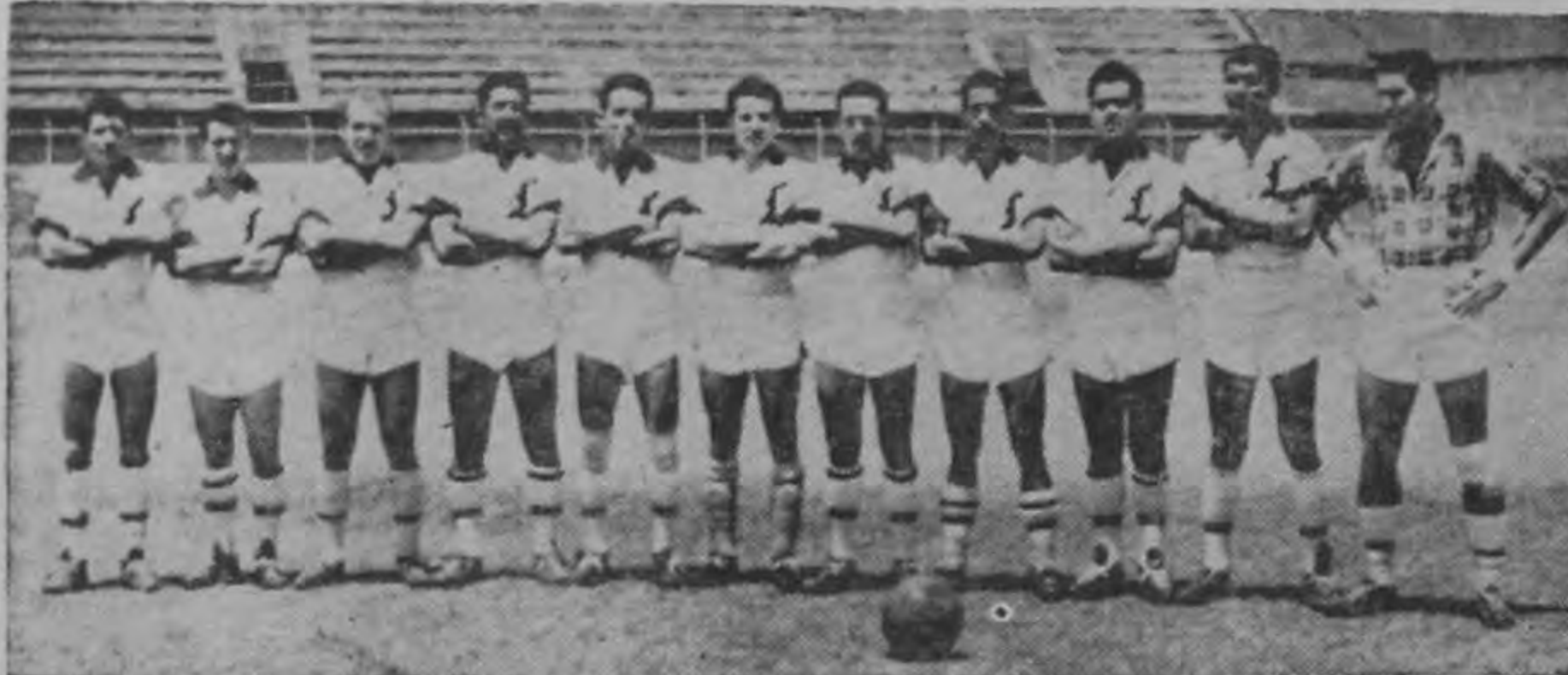
Los decanos esperan conseguir una nueva victoria para asegurarse una buena posición