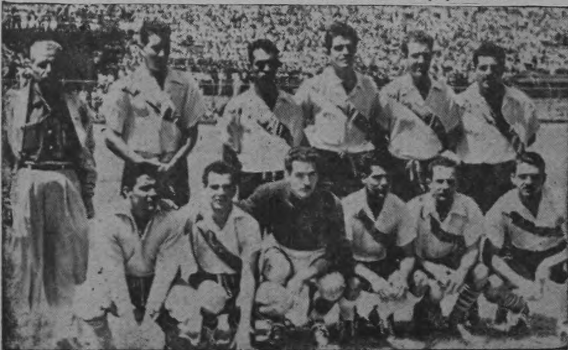
Los campeones vienen al Estadio Nacional a tratar de llevarse los dos puntos