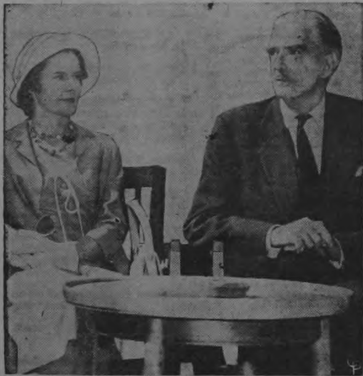
Sir Anthony Eden, ex-Primer Ministro de Inglaterra y Lady Eden aparecen en su residencia en Inglaterra. Sir Anthony recientemente fué sometido a una operación abdominal en Boston.